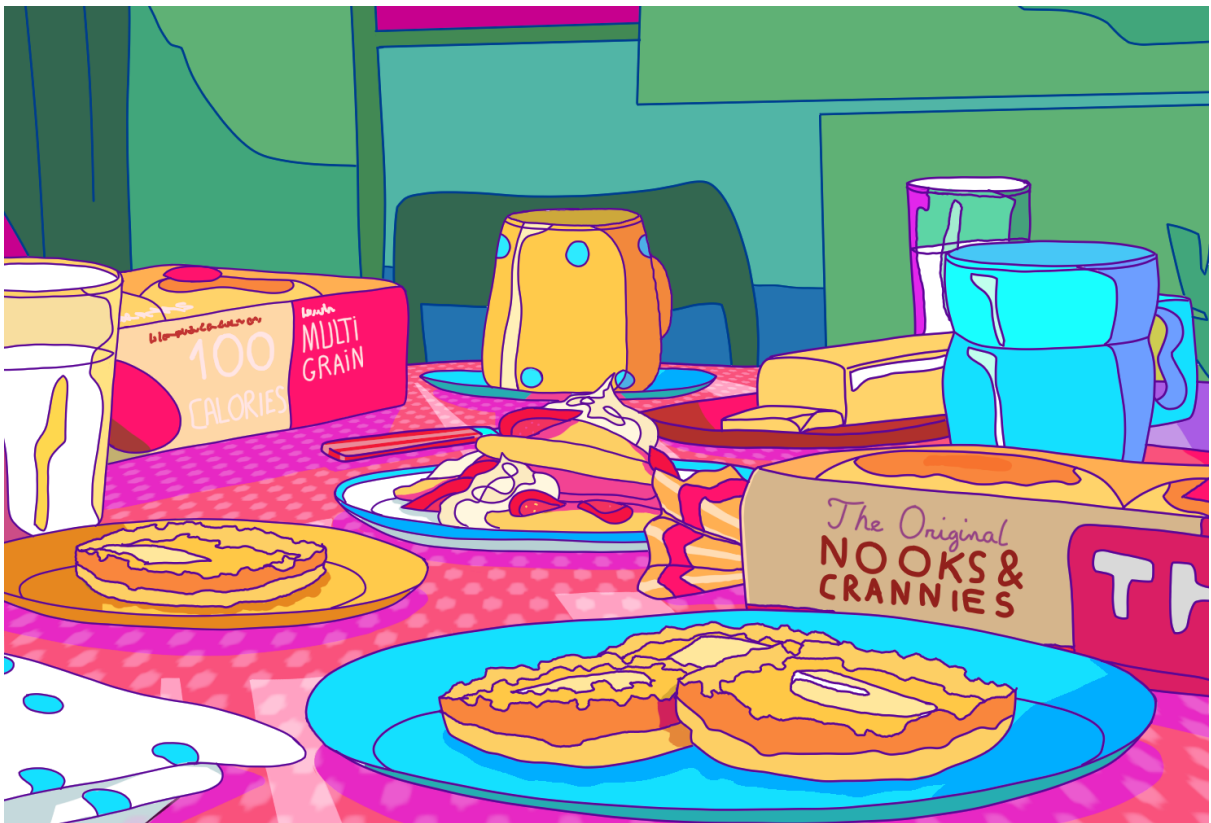
Exemple de nature morte réalisée par un étudiant de L1.