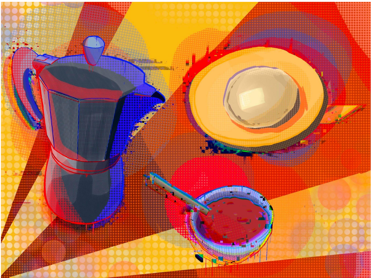
Exemple de nature morte réalisée par un étudiant de L1.