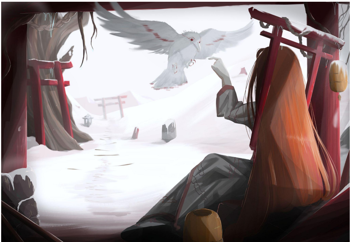
Illustration sur le thème "décor et paysages" réalisée par un étudiant de Licence 1.